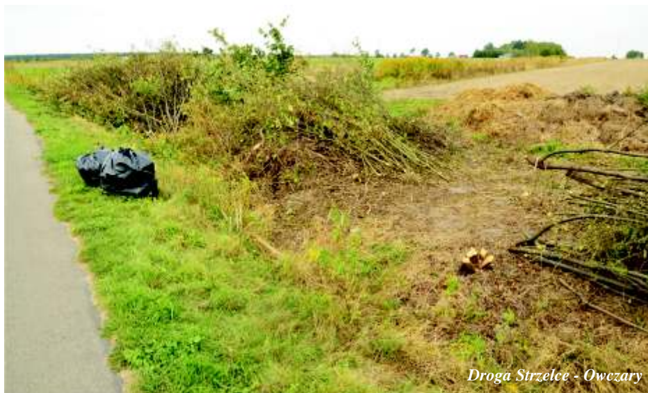
Droga Strzelce - Owczary